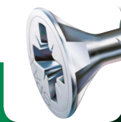
Sottotesta polivalente con incavi