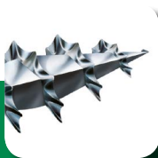
Estremità quadra autoforante